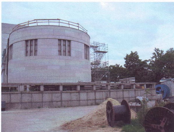
Pohled na zadní část památníku