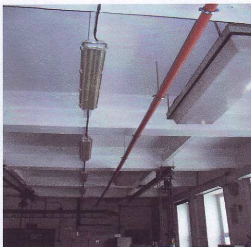
Trasa výtlačné kanalizace v dílně, vedená pod stropem

Potvrzení objednatele : ČEZ, a.s. Duhová 2/1444, Praha 4