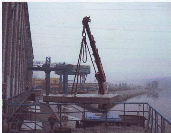
Ukládání prefabrikovaného stropu jímky

Popis prací: provedení stavebních úprav a sanace stávající akumulční jímky, její vystrojení novou čerpací technikou. Z této jímky jsou odpadní splaškové vody přečerpávány výtlačným potrubím do stávající gravitační kanalizace v budově vrátnice, odkud natékají do obecního kanalizačního řádu. Potrubí výtlačku je vedeno prostorami podzemního podlaží elektrárny, dále vnitřním instalačním kanálem (v podlaze kabelového kanálu), který na hranici budovy elektrárny přechází v panely zakrytý vnější instalační kanál končící u budovy dílny. V dílně je potrubí vyvedeno pod strop objektu a následně prochází do umývacího koutu v přízemí budovy vrátnice, kde je napojeno do stávající gravitační kanalizace. V prostoru vnějšího instalačního kanálu je potrubí výtlačku tepelně izolováno vnějším izolačním pouzdrem a pro zabezpečení v zimních měsících je potrubí opatřeno topným kabelem s automatikou spínání.