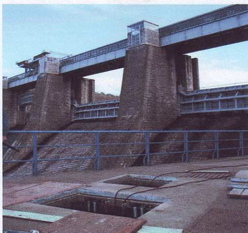
Pohled na odkrytou čerpací jímku, v pozadí objekt přehrady